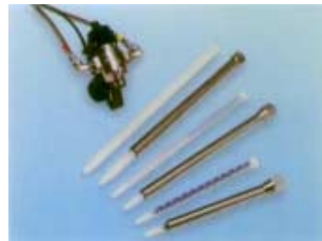
Pistolet dozujący Twinmixer III z mikserami statycznymi